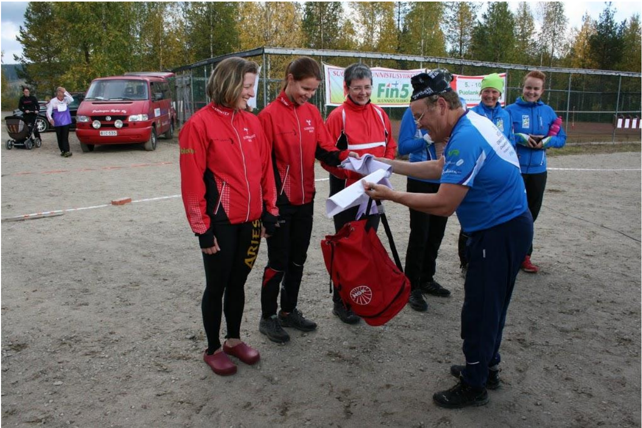
Suomussalmen Rastin naiset suunnistivat maakuntaviestissä kolmanneksi.