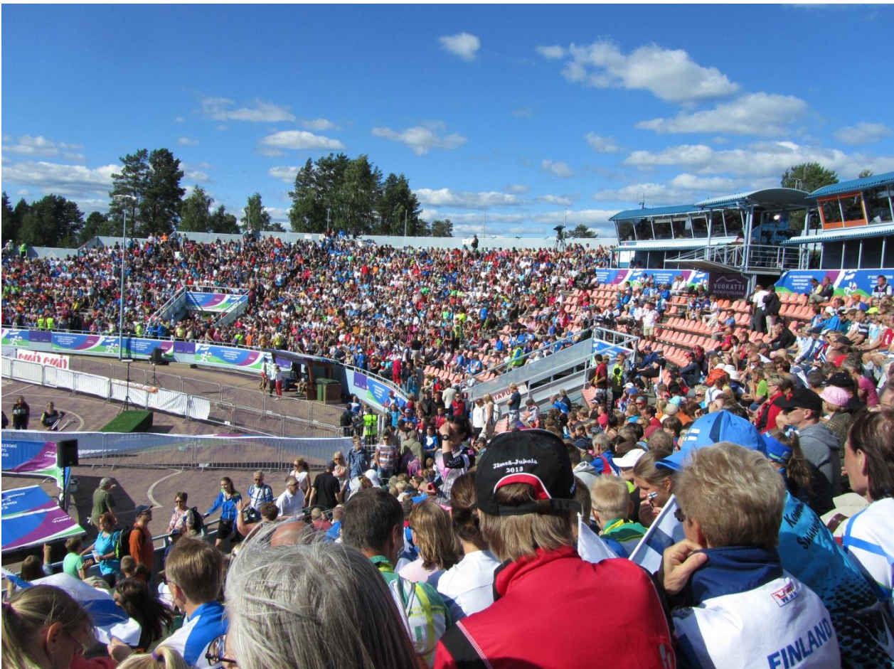
Sotkamon Hiukka-areenalla oli tiivis tunnelma MM-kisojen avajisseremonioita odotellessa.