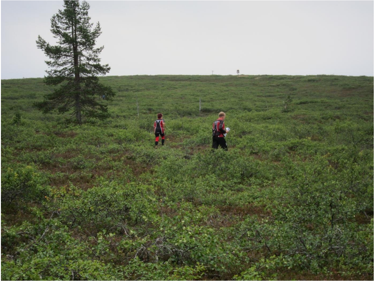
Saariselällä suunnistajat saivat kiivetä ylös tunturiin.