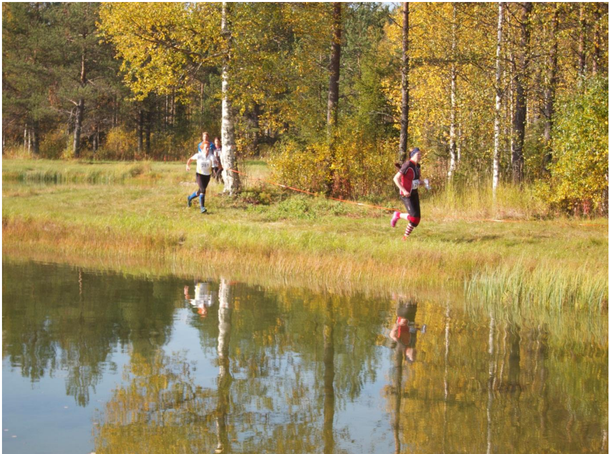
Maakuntaviesti kisattiin Paljakassa.