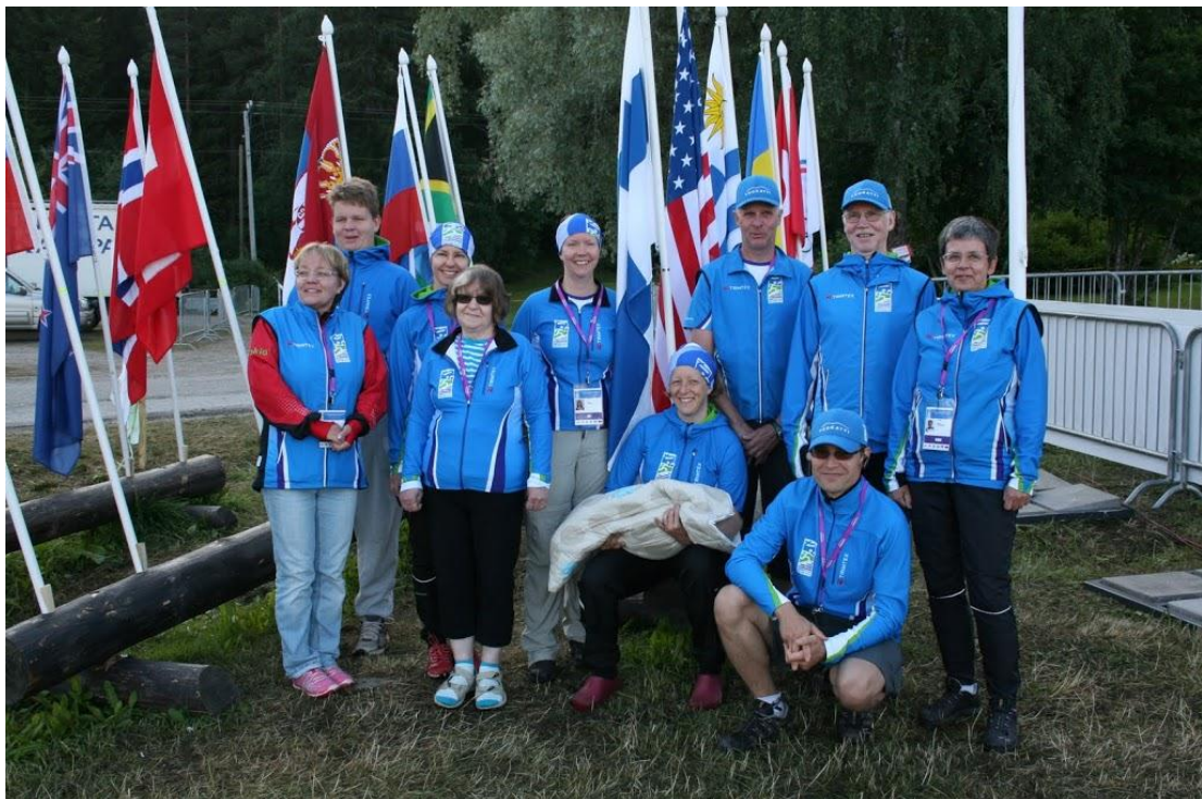
Suomussalmen Rastin talkoolaisia virallisissa kisa-asuissaan.

Tapahtumien yhdistäminen toi MM-kisoihin runsaasti yleisöä ja Rastiviikko toi tekemistä MM-kisojen välipäiviin. Kaiken kaikkiaan Vuokatissa oli 750 talkoolaista ja 15 000 kisavierasta. Kainuun Rastiviikkoon osallistui ennätyselliset 9166 suunnistajaa, joten juomapisteillä oli kuumina päivinä täysi tohina päällä, jotta kaikki janoiset saivat urheilujuoma- tai vesimukinsa. Vuokatin monipuolinen majoitus- ja aktiviteettitarjonta mahdollisti omalta osaltaan onnistuneen suunnistusviikon järjestämisen.